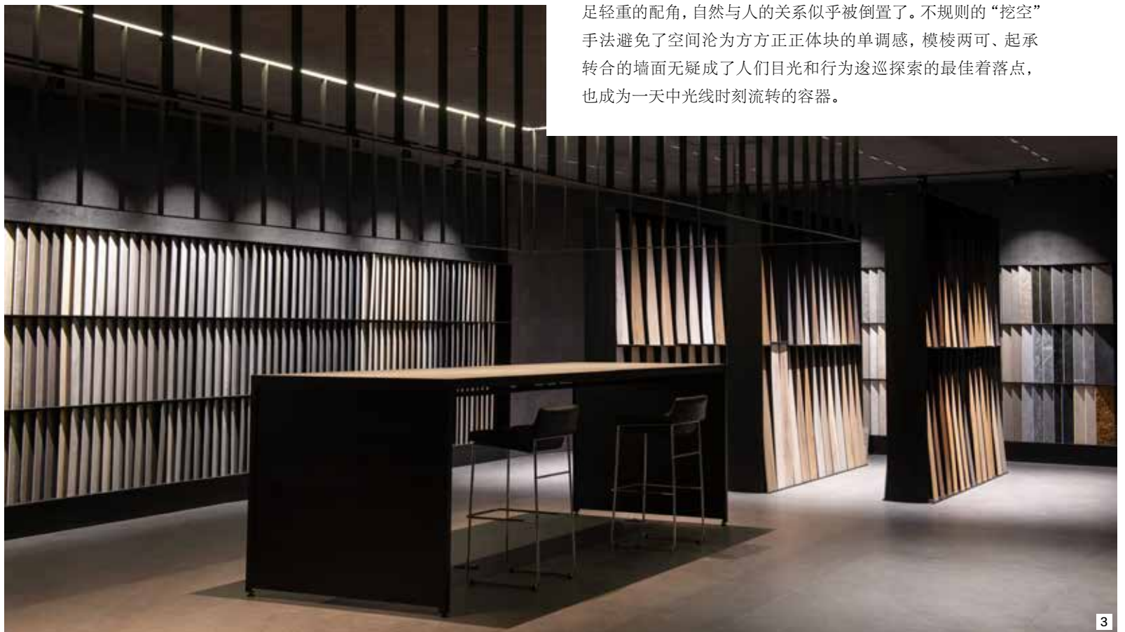
3 / 陈列着石材和木材样品的展览室，不同产品肌理构成空间中独一无二的装饰风景。

公元前4世纪建造的帕特农神庙至今仍然是建筑史上无法磨灭的一页，这不仅仅因为其古典高洁的形制符合人们心中对于秩序与比例的永恒追求，也是因为使用的大理石等坚固材质使其伫立千年而不倒，否则只能像巴比伦空中花园那般成为世人无缘凭吊的虚空符号。如今，一座同样由大理石构建、史诗般壮丽的建筑在希腊跨海之隔的墨西哥瓜达拉哈拉（Guadalajara）地区落成，这栋建筑一经建成即成为全球各大媒体的报道对象，外表低调、内藏乾坤，墨西哥建筑事务所 Esrawe Studio 在此打造了一场气势恢宏的材料交响曲。