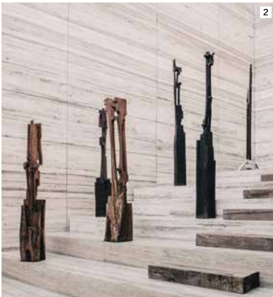
2 / 阶梯是重要的设计元素，介于正式与非正式之间，它直接引导人们在此憩息、交流、集会。 摄影 / Genevieve Lutkin