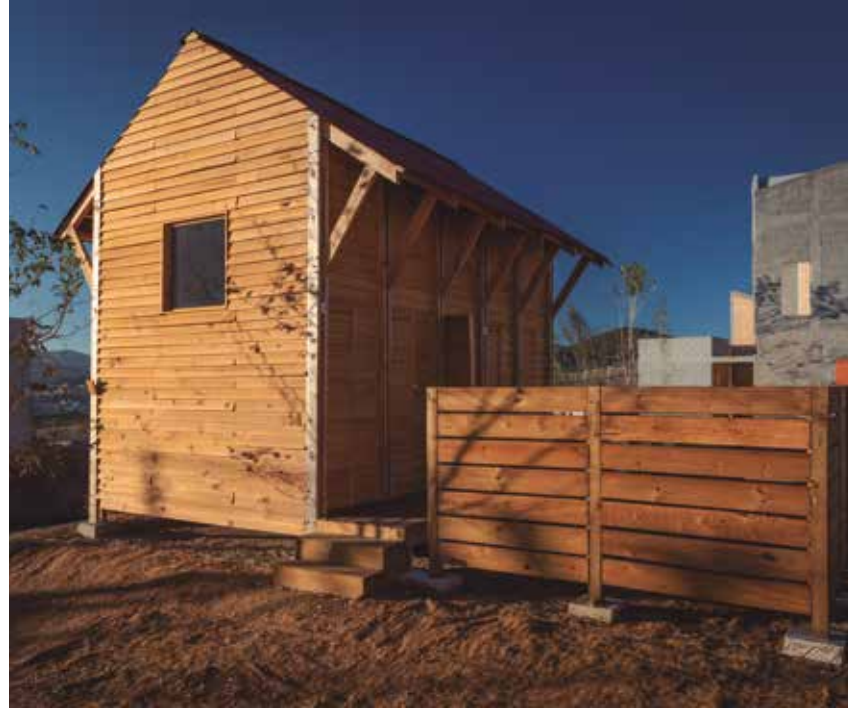
Dellekamp apuesta por dos niveles, una cerca de pallets y la utilización de pino, material económico y de fácil manipulación.