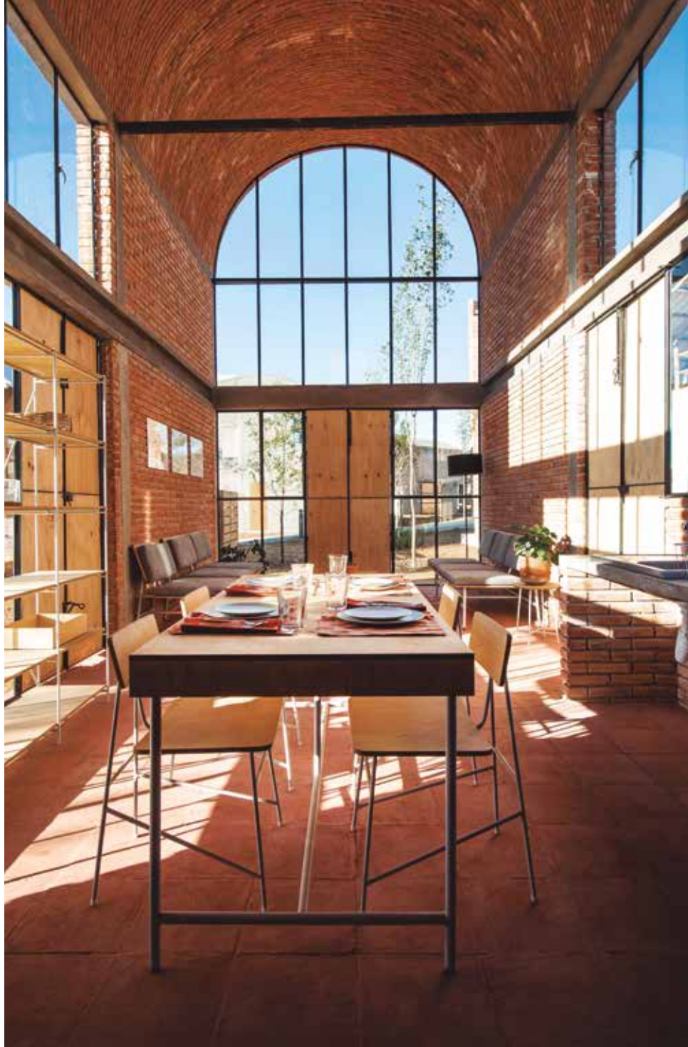
El prototipo de Frida Escobedo cuenta con una bóveda corrida, muros de ladrillos de arcilla y pisos de concreto, además de la segunda colección de Esrawe, inspirada en el diseño nórdico y la Bauhaus.