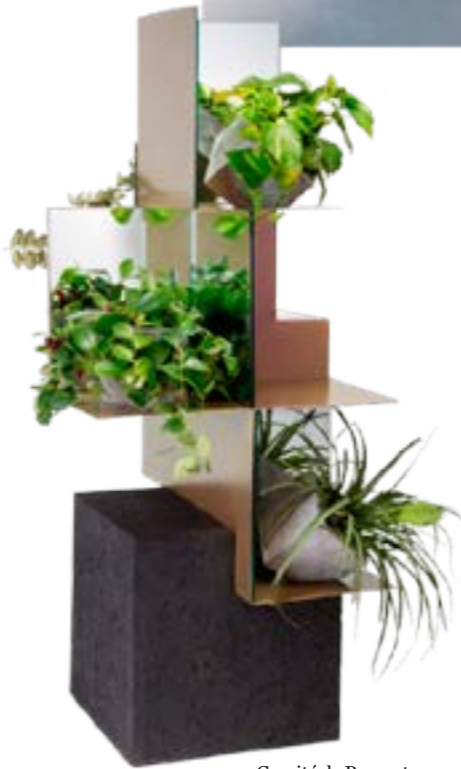
Comité de Proyectos