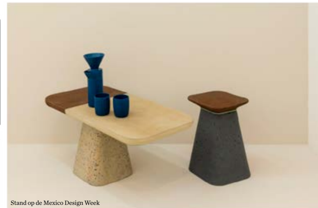
Stand op de Mexico Design Week

Waarom begon je tien jaar geleden Design Week Mexico? 'Het was nodig om te laten zien wat de waarde is van Mexicaans design, maar ook dat design een instrument kan zijn voor verandering. DWM is een platform voor analyse, dialoog, creatie en connectie. Het is nodig om design en architectuur centraal te stellen, omdat die een grote bijdrage kunnen leveren aan de verbetering van onze steden en publieke ruimtes, en daarmee aan kwaliteit van leven. We proberen ontwerpers ook te stimuleren om groter te denken. Ze zijn prima geschoold, maar werken soms te individueel. Als DWM zijn we aanjagers in het bouwen van een Mexicaanse creatieve industrie.'