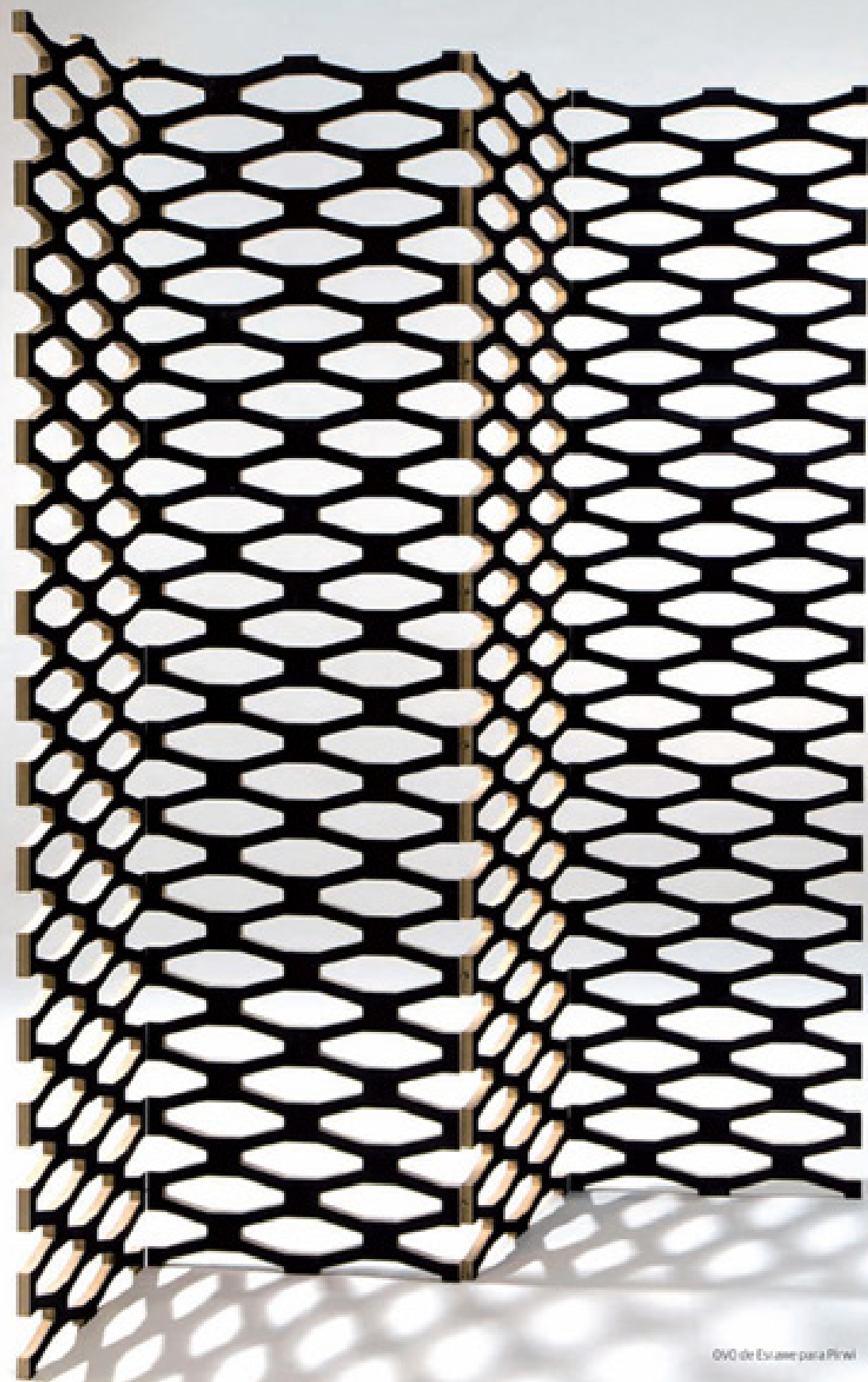
OVO de Etsinor para Pirvi