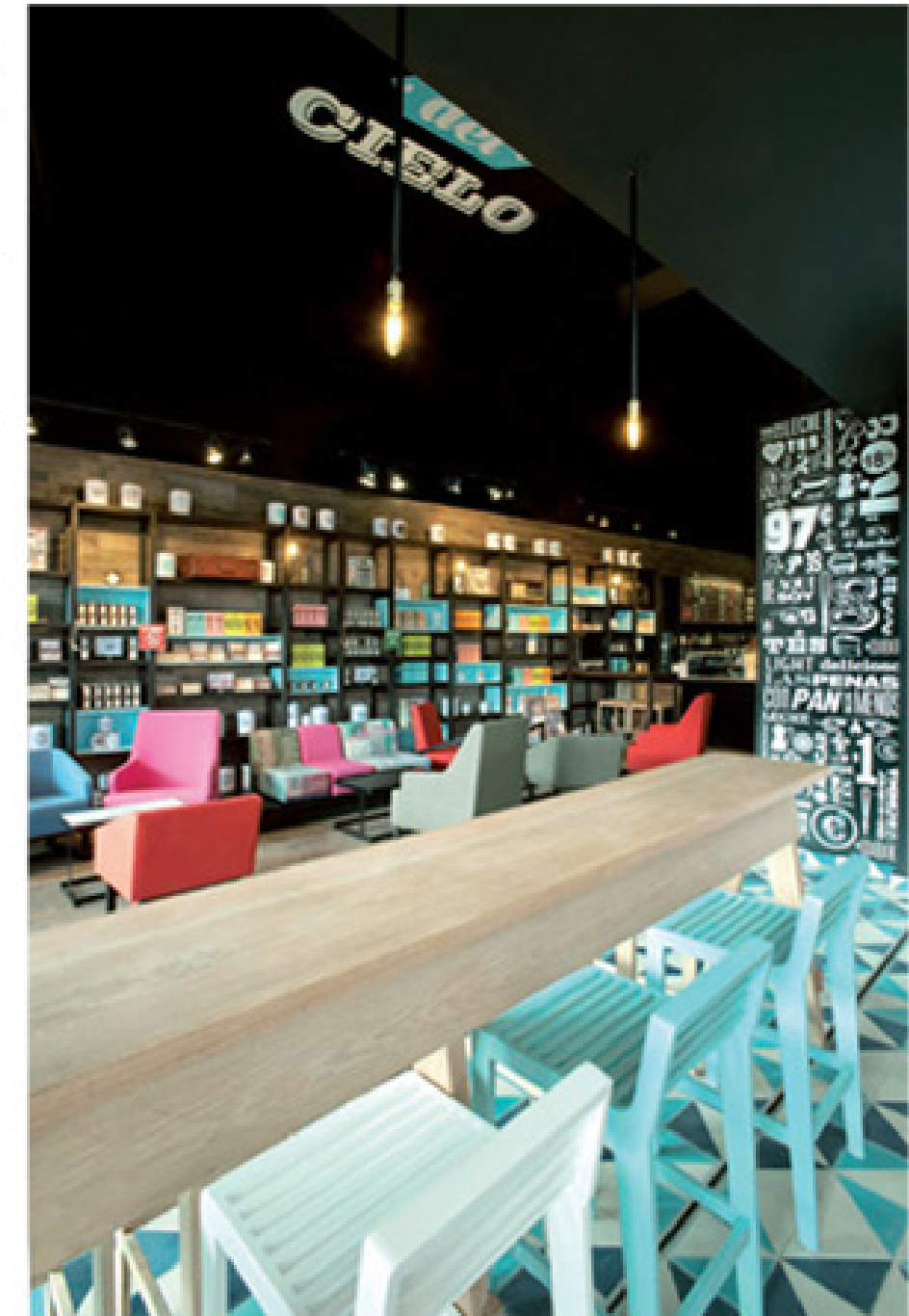
Café Cuando Café

mente empecé a trabajar desde la universidad, siempre convencido de que había muchas más posibilidades para el diseño de las que nos daban.