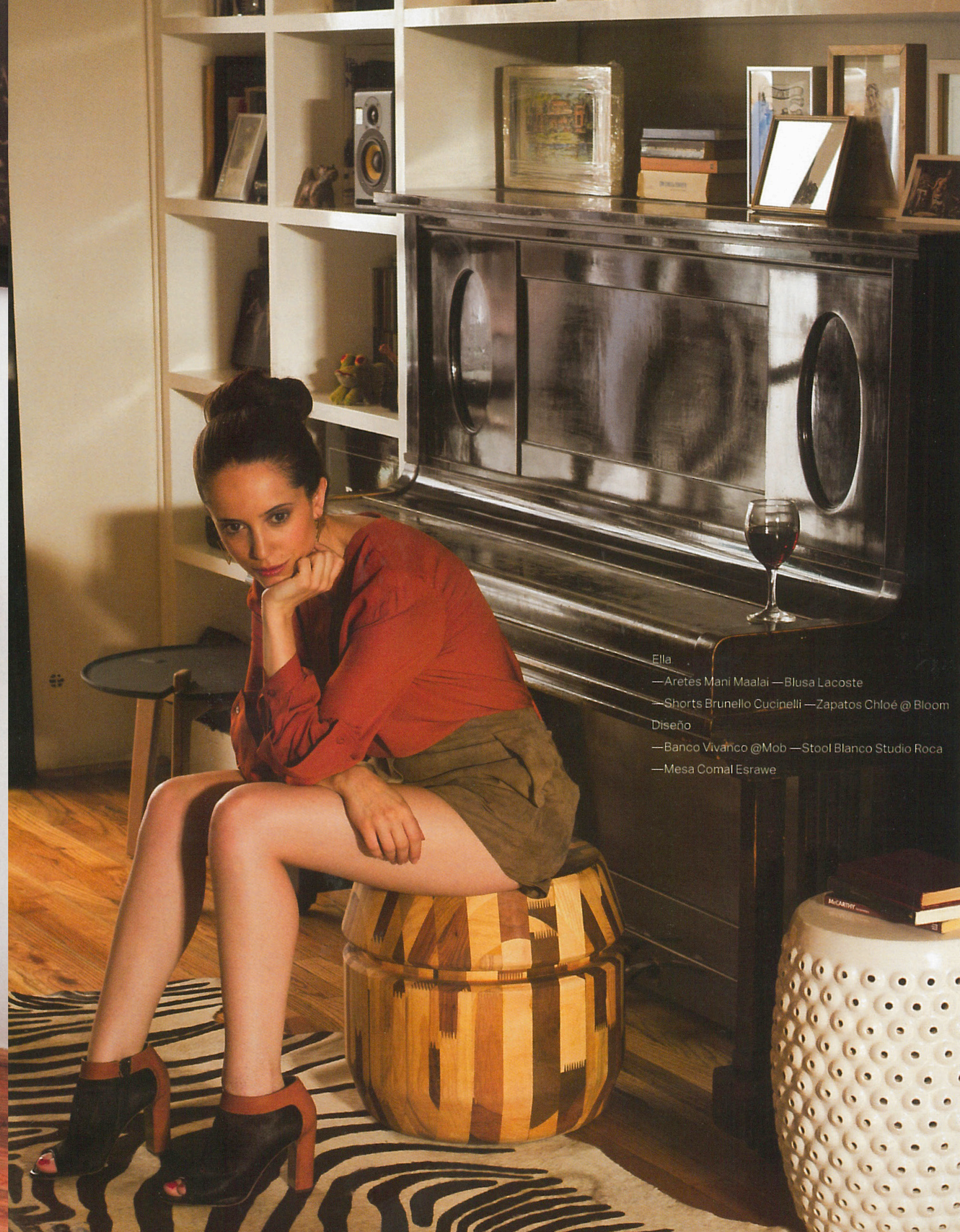
Ella — Aretes Mani Maalai — Blusa Lacoste — Shorts Brunello Cucinelli — Zapatos Chloé @ Bloom Diseño — Banco Vivanco @ Mob — Stool Blanco Studio Roca — Mesa Comal Esrawe